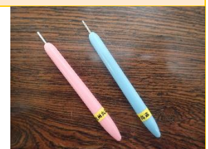
クイリングスロット